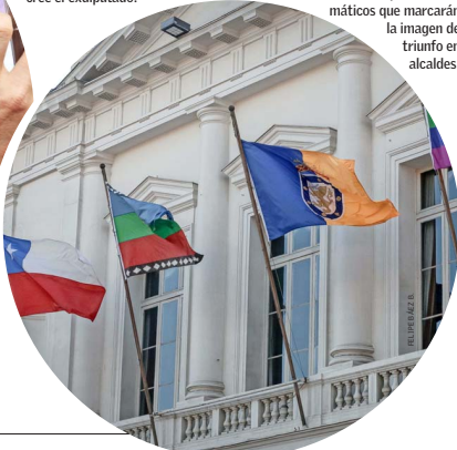
Santiago será uno de los municipios emblemáticos que marcarán la imagen de triunfo en alcaldes.