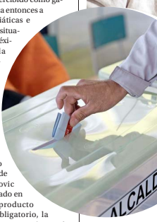
Kast y republicanos experimentarán una recuperación ante la opinión pública, dice el analista.

Sin embargo, dice que depende de dónde se pone la mirada, pues aunque aumenta este tipo de sufragio, también lo hacen los votos válidos, lo que considera positivo.