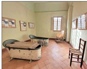
Tinas de latón utilizadas para fines curativos en el sanatorio.