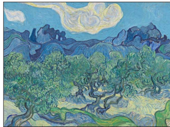
Una y otra vez el artista retrató olivos retorcidos. Algunos los pintó al aire libre (en el análisis de la pintura apareció materia vegetal). También usó novedosos tonos de óleo, que recién se comercializan.