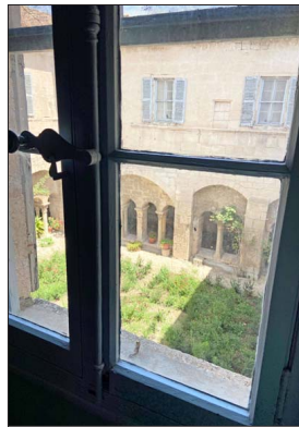
Más de cien pinturas y muchos dibujos realizó Van Gogh en el sanatorio. Algunas las hizo mirando por una ventana, como la famosa "Noche estrellada".

En París entabla amistad con artistas de vanguardia y descubre como fuente de inspiración las estampas japonesas, cuyos planos audaces y contrastes de color le causan honda impresión.