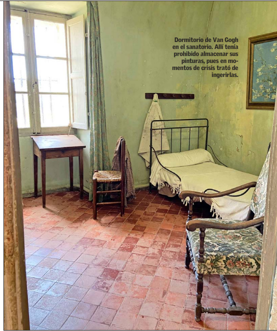
Dormitorio de Van Gogh en el sanatorio. Allí tenía prohibido almacenar sus pinturas, pues en momentos de crisis trató de ingerirlas.

60 obras producidas por Van Gogh en los dos años que pasó en el sur de Francia —desde febrero de 1888 a mayo de 1890— son las que exhibe la National Gallery de Londres para celebrar sus 200 años de vida. Hasta el 19 de enero de 2025 estará abierta al público esta "efusión" de obras maestras del artista holandés, su movimiento incesante y su alucinante paleta de colores, rasgos que se acentúan en este período. Hay famosas obras realizadas en Arlés, como "El dormitorio" y "La casa amarilla", y otras realizadas en el hospital de Saint-Rémy, donde el artista se interna, por su propia voluntad, en 1889. La muestra se titula "Poetas y Amantes", en alusión a dos autorretratos que se exhiben, aunque se podría decir que es la naturaleza la gran protagonista.