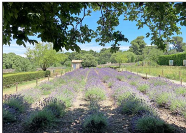
Campos y jardines con cipreses, romero, lavanda y laureles rodean el hospital.

Con sus tickets online agotados hasta diciembre, una nueva muestra en la londinense National Gallery se enfoca en las pinturas que Van Gogh realizó en la Provenza, en especial en el sanatorio de Saint-Rémy, donde aún se respira su presencia en cada rincón.