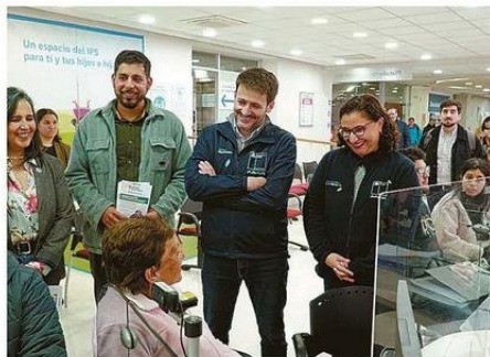
EL MINISTRO ESTUVO EN OFICINAS DE CHILEATIENDE, EN VALPARAÍSO.