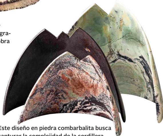
Este diseño en piedra combarbalita busca capturar la complejidad de la cordillera.