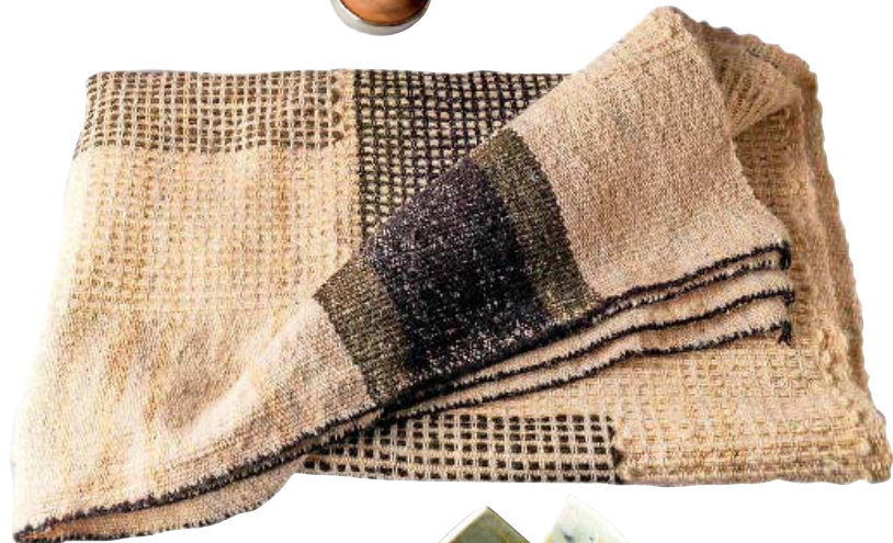
Frazada tejida en tela kelwo y con teñido con plantas locales.