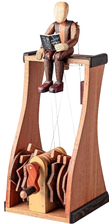
Autómata de madera, con un perfecto ensamblado de figura y mecanismo.