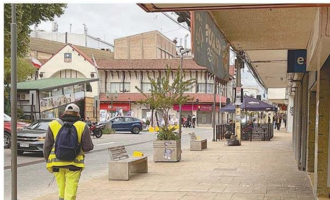
EL LUGAR DONDE GOLPEARON A LA JOVEN. LAS CÁMARAS -AL FONDO-NO REGISTRARON LA GOLPIZA.

Aún en shock y con los signos de violencia sufridos, a los pocos minutos