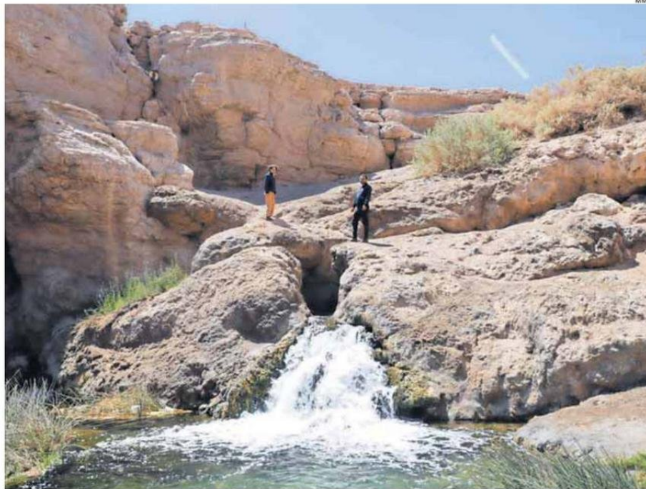
OJO DE OPACHE ALBERGA PATRIMONIO CULTURAL, NATURAL Y ENDÉMICO DE LA ZONA.