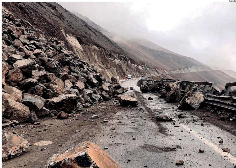
LAS OBRAS DE REPARACIÓN DE LAS AFECTACIONES A LA RUTA 5 NORTE PODRÍAN EXTENDERSE POR 12 MESES.

En este contexto, Pfeiffer, indicó que "hemos estado en terreno, hemos revisado el contrato, hemos hecho un levantamiento de la zona y estamos planificando en el más breve plazo soluciones concretas para poder mejorar la seguridad y el tránsito en el área afectada, junto definir un proyecto que dé mayor estabilidad a este sector de la ruta de 27 kilómetros, que presenta afecta-