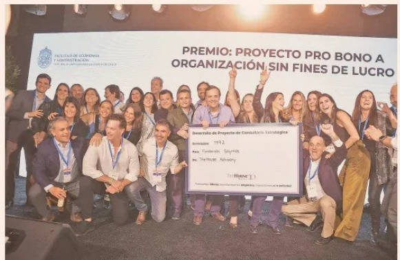
Entrega premio generación 1992 Ingeniería Comercial UC.