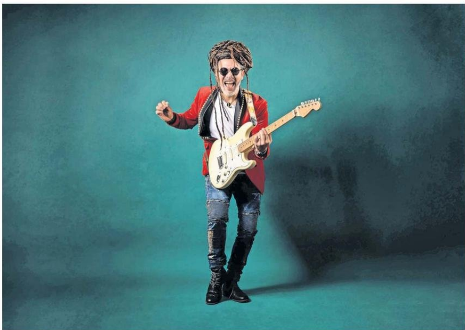
QUIQUE NEIRA SERÁ UNO DE LOS ARTISTAS QUE PARTICIPARÁ EN LA GIRA TELETÓN 2024.