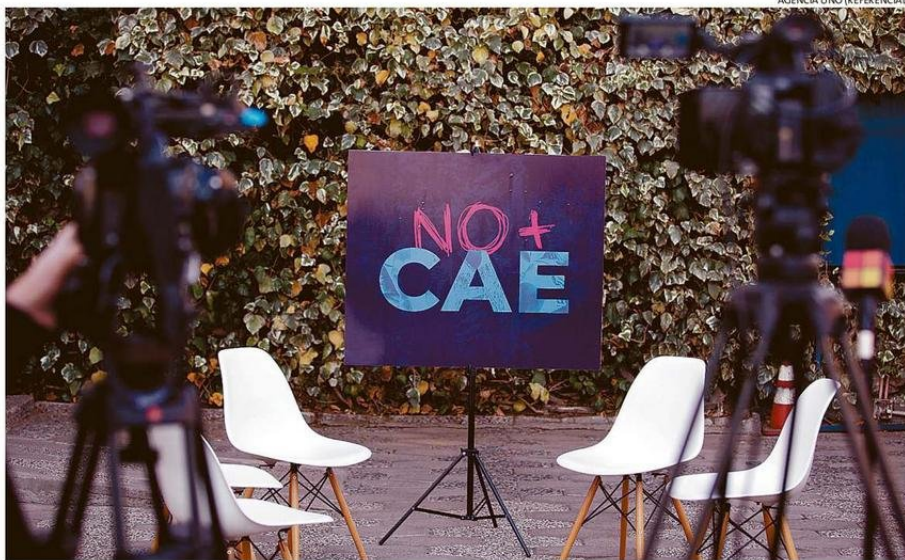
DESDE QUE SE CREÓ EL CRÉDITO CON AVAL DEL ESTADO, MÁS DE 1.200.000 PERSONAS, A NIVEL NACIONAL, SE HAN VISTO BENEFICIADAS.