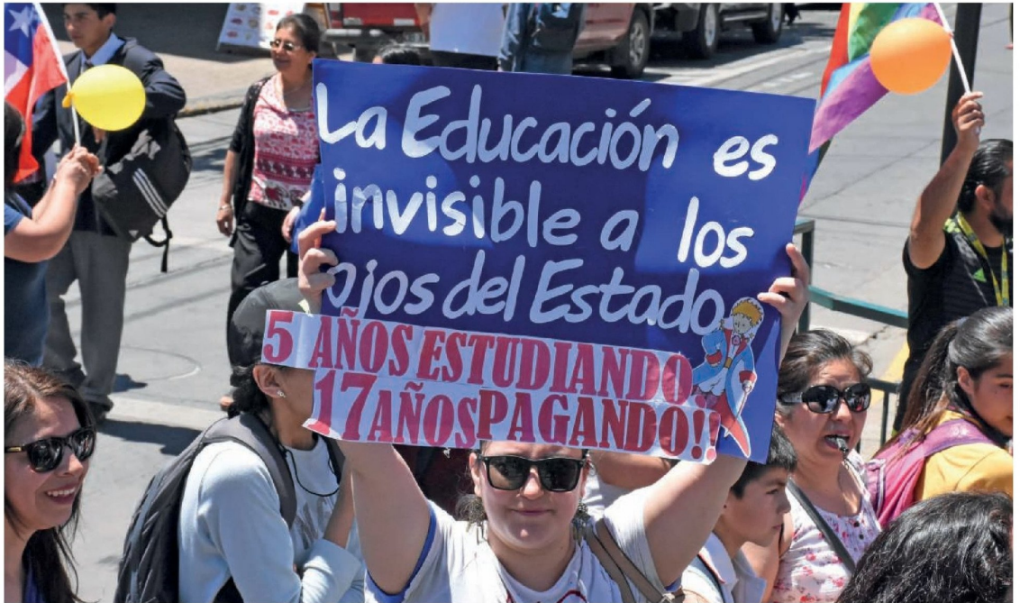
LA DEUDA POR EL CAE ha sido uno de los grandes reclamos en las protestas sociales.

El proyecto ha suscitado reacciones diversas entre parlamentarios del Biobío, quienes destacan la urgencia de analizar sus detalles y su impacto en los deudores, realizando un estudio exhaustivo y responsable de sus implicaciones.