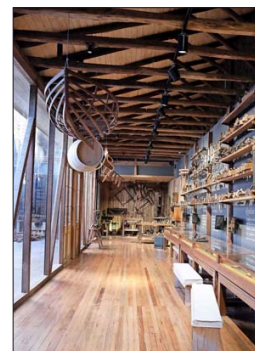
Museo Taller, en el barrio Yungay, brindará la posibilidad de aprender haciendo.