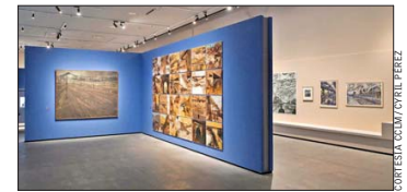
"Por la línea corre el tren" se podrá visitar hasta las 21:00 horas y con entrada gratuita en el CCLM.