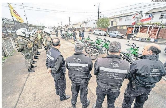
SAMEDRINOS DICEN ESTAR PREOCUPADOS POR LOS ACTOS DELICTUALES QUE OCURREN EN LA COMUNA.