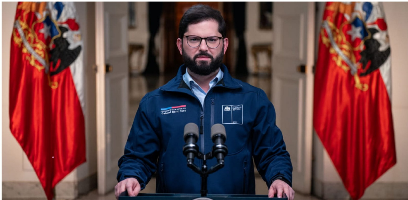
► Ahora que el proyecto fue presentado por parte del Presidente Boric, La Moneda apostará por un fuerte despliegue en la materia.

GABRIEL BORIC, PRESIDENTE DE LA REPÚBLICA