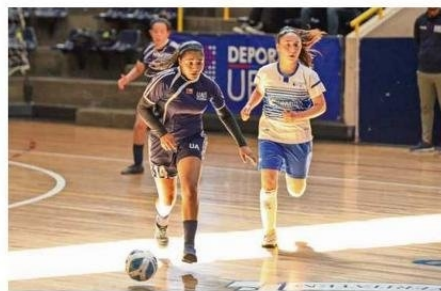
EL TORNEO UNIVERSITARIO SE REANUDARÁ HOY A LAS 9 HORAS.

El programa también incluirá los encuentros Universidad de Antofagasta-Universi-