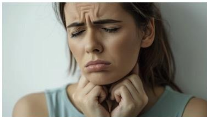
Síntomas como dolor muscular y problemas cognitivos son propios de la fibromialgia.