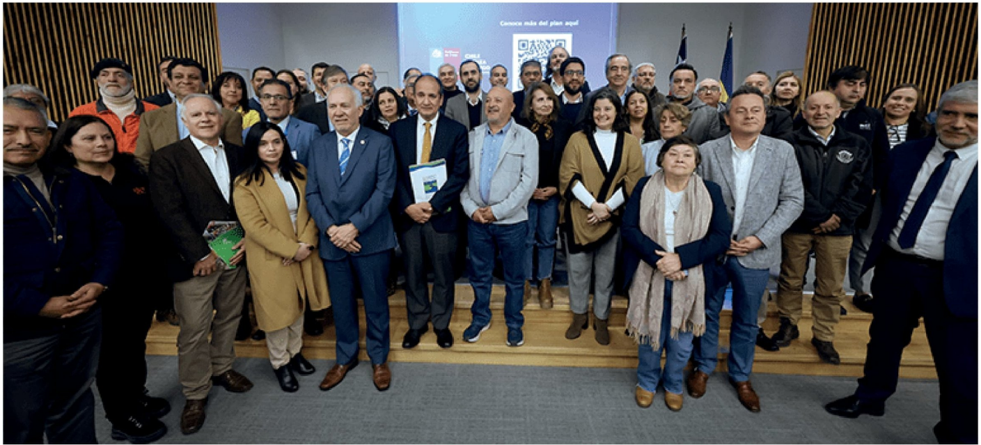
LA CEREMONIA DE PRESENTACIÓN del Plan de Fortalecimiento Industrial del Biobío se realizó recientemente en Concepción.