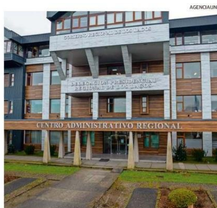
NUEVOS PROCESOS Y PROCEDIMIENTOS SE INSTAURARÁN EN EL GORE.

(PS), core por Osorno, todavía debe evaluarse el trabajo de mejoras que ha realizado en el Gobierno Regional, así como su efectividad. “Lo que sí yo puedo plantear como consejero regional es que debe haber una cultura de control interno donde todos los miembros integrantes, funcionarios, profesionales, jefes de División sean parte de ese control interno. Debe existir un control interno que no solamente recaiga en las jefaturas del servicio, sino que exista un control interno