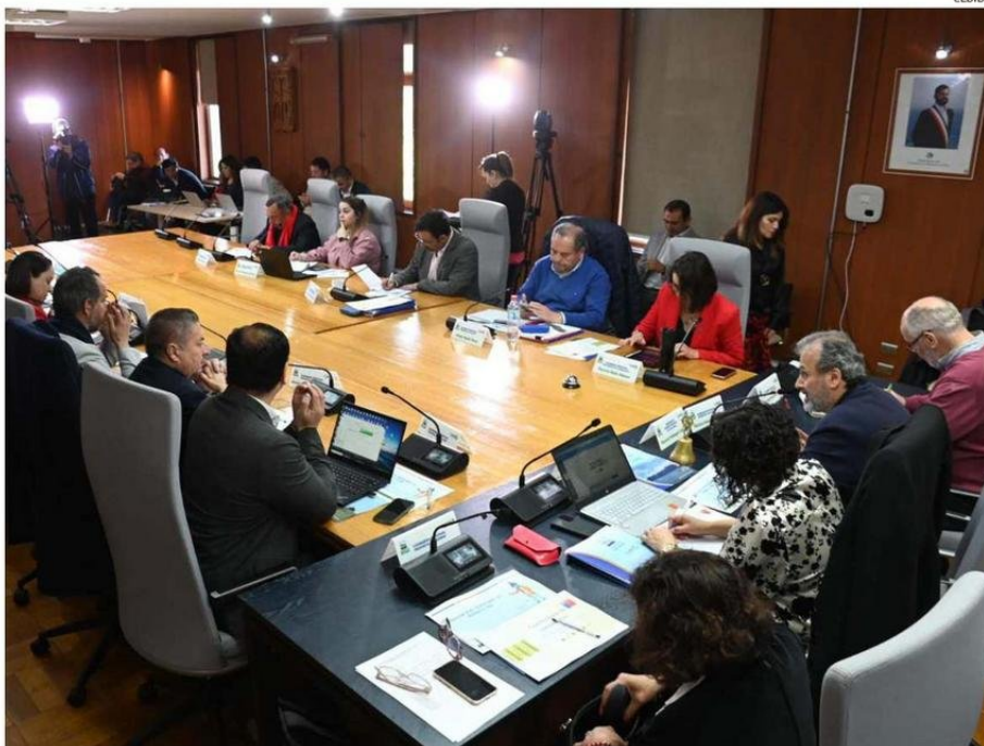
CONSEJEROS REGIONALES EVALUARON LAS MEJORAS EN LOS PROCESOS INTERNOS COMO INSUFICIENTES, TRAS LO OCURRIDO CON EL CASO CONVENIOS.

gestionados a través del Fondo Regional de Inversión Local (Fريل) a los municipios, lo cual tendrá una nueva plataforma.