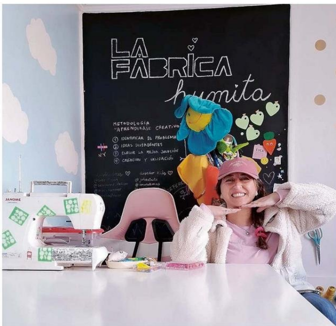
EN EL CENTRO CULTURAL ABRIRÁ SU TALLER "HUMITA" PARA SEGUIR PROMOVIENDO LA CREATIVIDAD.

-Sacamos como conclusión que el proyecto es exportable. Hay que hacerle algunos arreglos que ya los estoy trabajando, también tener listas algunas traducciones de los pasos y mostrar más sobre Chile y