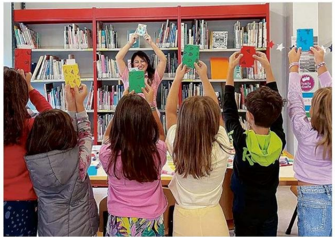
UNO DE SUS TALLERES DE DISEÑO SUSTENTABLE EN LA BIBLIOTECA CHIESAROSSA EN MILÁN, ITALIA.

haciendo cosas. Entonces me volví experta en crear objetos (río). Ellos se sienten identificados en que con las cosas simples que tienen pueden crear. Desde ahí parte el proceso y no paran. Cuando terminan su producto, en este caso realizaron la encuadernación, crearon un personaje, el libro y un muñeco en la misma línea. Después no se quieren ir, desean seguir pintando y agregándole detallitos, cosas así.