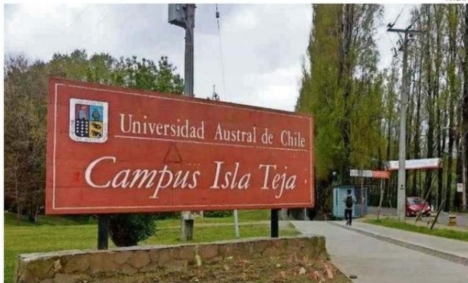
LA CASA DE ESTUDIOS ENFRENTA CRISIS FINANCIERA, LA CUAL ESTA SIENDO ABORDADA JUNTO A LA SES.