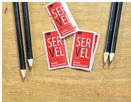
PRÓXIMAS ELECCIONES SE REALIZARÁN ESTE MES.

En Chile, los extranjeros avecindados por más de cinco años podrán ejercer el derecho a sufragio que consagra el