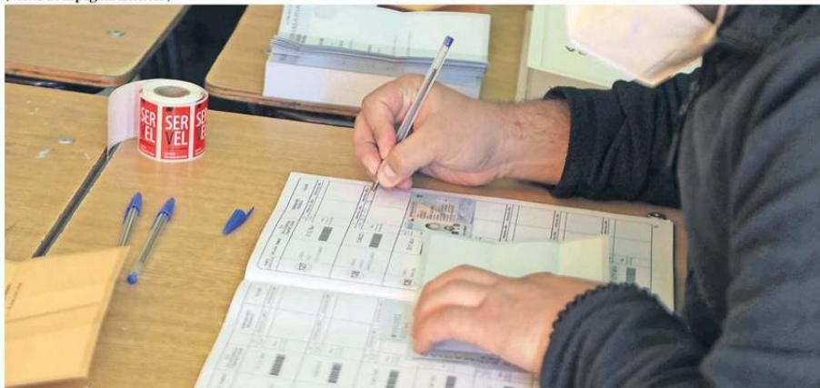
DESDE LA CONSULTORA NÓMADE INDICARON LA NECESIDAD DE FOMENTAR LA PARTICIPACIÓN Y VOTO EXTRANJERO.