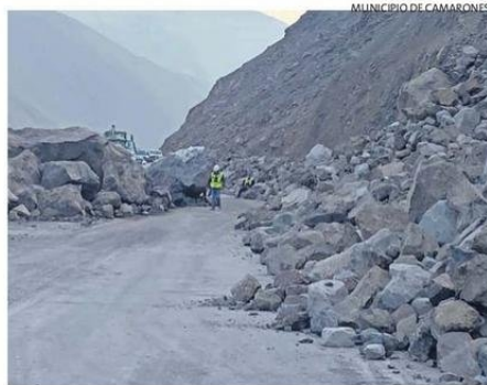
DESDE EL 1 DE OCTUBRE SE VIENEN PRESENTANDO CORTES.

Venegas agregó que la institución entregó a las autoridades locales un informe técnico flash (preliminar), con recomendaciones con el objetivo de