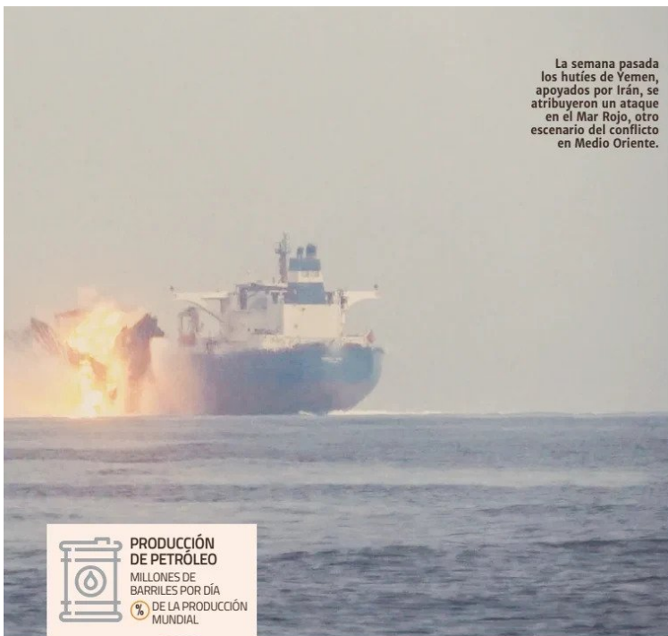
La semana pasada los huties de Yemen, apoyados por Irán, se atribuyeron un ataque en el Mar Rojo, otro escenario del conflicto en Medio Oriente.