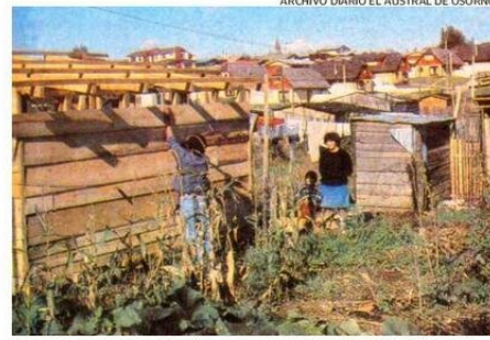
NUEVAS FAMILIAS LLEGARON AL CAMPAMENTO O'HIGGINS EN 1990.

"Para 1995 está programada la erradicación del campamento Bernardo O'Higgins, en