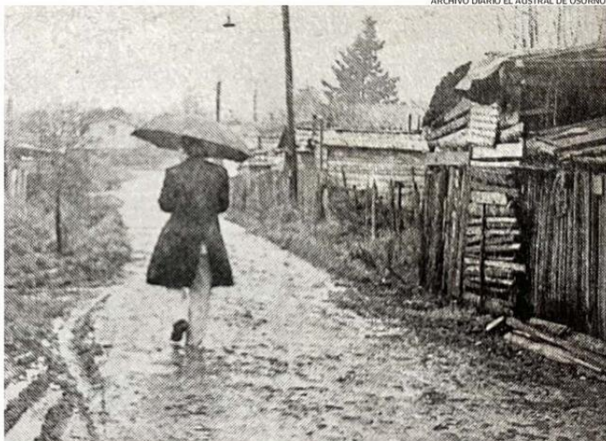
ASÍ ESTABA EL ASENTAMIENTO IRREGULAR EN 1994. AL AÑO SIGUIENTE COMENZÓ LA ERRADICACIÓN FINAL.

La siguiente erradicación ocurrió en 1989, cuando los pobladores del Bernardo O'Higgins fueron trasladados a