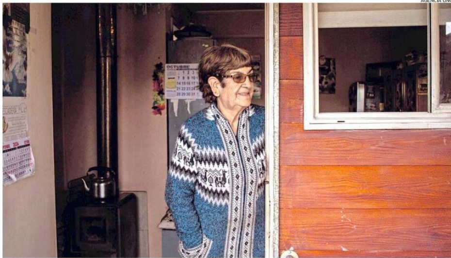
LAS VIVIENDAS TUTELADAS FORMAN PARTE DE LOS PROGRAMAS DE APOYO A LOS ADULTOS MAYORES.

Sobre cómo las familias pueden acceder, explica que está el Registro Social de Hogares. “Acuden a un municipio y manifiestan que es cuidadora o que requiere de un cuidado. Se extiende un certificado y con ello se puede acceder a los programas de Desarrollo Social”.