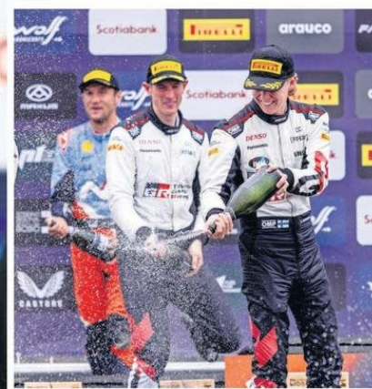
Kalle Rovanperä se impuso el pasado fin de semana en los caminos rurales de la zona.

nión con el hoy gobernador. Una década más tarde, el productor general saca cuentas alegres, destacando el nivel competitivo de las pistas rurales de la provincia de Biobío y la cordillera de Nahuelbuta. “Esta es una fecha que está en el borde de la definición del campeonato, y le da espectacularidad, permite que la gente de la Región –en la medida que le informe-