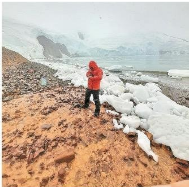
Trabajo en terreno durante el verano antártico del año 2022 (Eca 58), en el sitio con generación de drenaje ácido de rocas en la caleta Cardozo, isla Rey Jorge.

vechadas para descontaminar compuestos tóxicos como el perclorato y el nitrato, presentes en efluentes de diversas industrias.