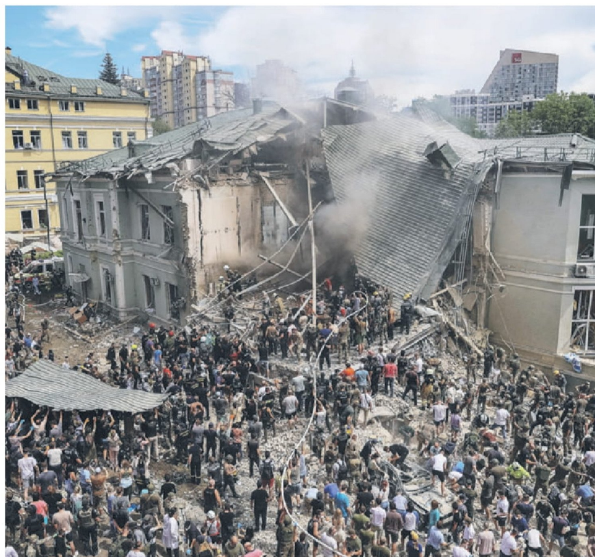
► Rescatistas trabajan en el Hospital Infantil Ohmatdyt tras un ataque con misiles rusos, en Kiev.