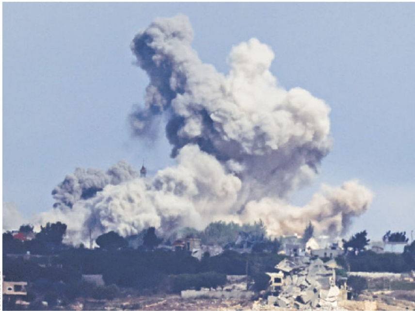
► Vista de un ataque aéreo israelí en una aldea en el sur de Líbano.