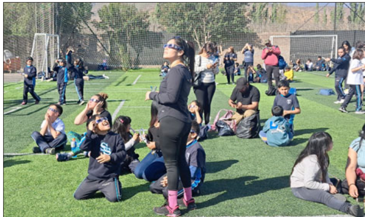
La actividad 'Aprendizaje Experiencial' del Colegio Sunnyland School comenzó a las 16:30 horas y finalizó a las 17:30 horas, coincidiendo con el final del eclipse solar que se observó de forma parcial en el Valle de Aconcagua.