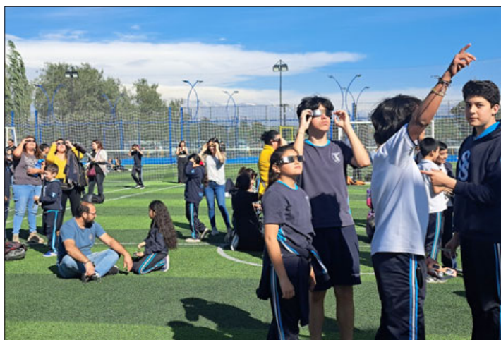
Se entregaron un total de 700 lentes certificados en colaboración con el Centro de Padres y la administración del colegio.

algo que se ve todos los días, obviamente si podemos ayudar en eso para que los niños vean cómo funciona el universo, vale la pena hacerlo.