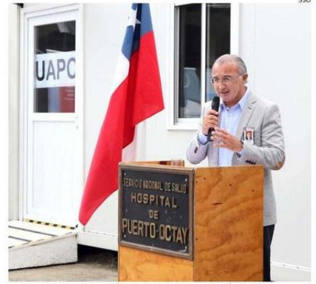
EL PROFESIONAL ASUMIRÁ A FINES DE ESTE MES EN RÍO NEGRO.