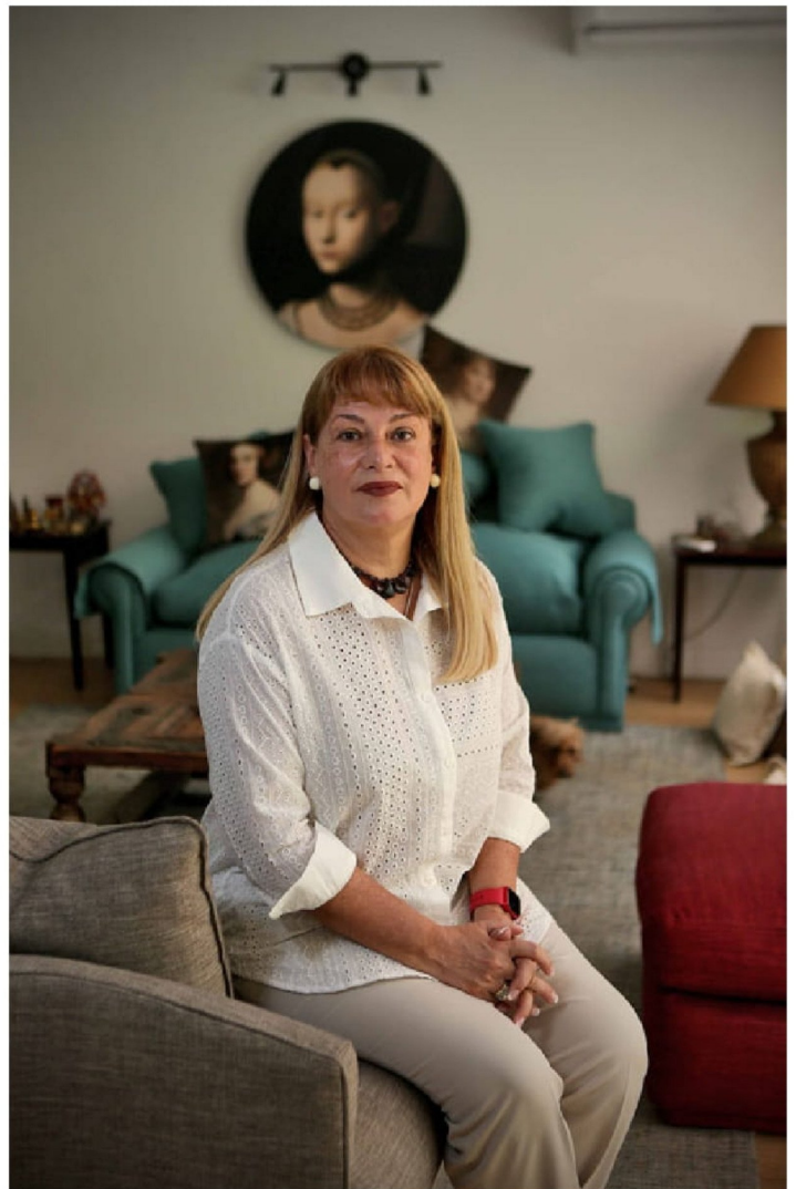
► La suspendida ministra Ángela Vivanco, enfrenta un cuaderno de remoción de la Corte Suprema desde el 9 de septiembre.

A ver, yo creo que la Comisión de Ética, que obviamente las comisiones de ética están pensadas para temas distintos, yo creo que la Comisión de Ética se ha desbordado absolutamente respecto de lo que se preten-