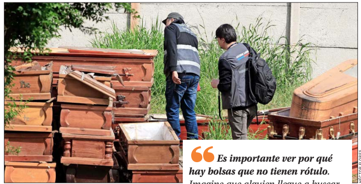
ATAÚDES. — Cajas mortuorias apiladas a metros de las bodegas y el crematorio hallaron también los fiscalizadores en su inspección.

El presidente de la Federación Nacional de Trabajadores de Ce-