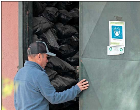
EN BOLSAS NEGRAS. — Las osamentas se encuentran acopiadas en dos bodegas del recinto.

Asimismo, el documento puntualiza que la bodega adyacente también es utilizada para guardar herramientas, palos, picotas, ras-