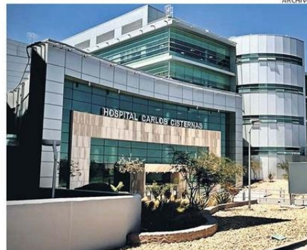
HOSPITAL DE CALAMA INVESTIGA FALLECIMIENTO DE MUJER DE 41 AÑOS.