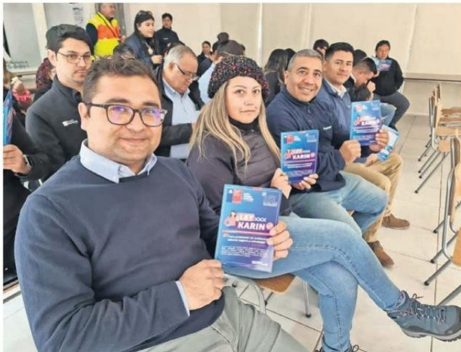
LA SEREMI DEL TRABAJO HA CAPACITADO A MÁS DE DOS MIL PERSONAS SOBRE LA LEY KARIN.

Cortés explicó que de estas denuncias, la mayoría son por acoso laboral. "Hay que recordar que detrás de cada denuncia no hay un número, sino una persona que está sufriendo en su entorno laboral y que necesita