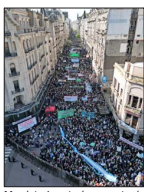
Mandatario vetaría aumento de presupuesto a planteles.

Masiva marcha de estudiantes y profesores pone bajo presión plan de ajuste de Milei a universidades públicas | A 5