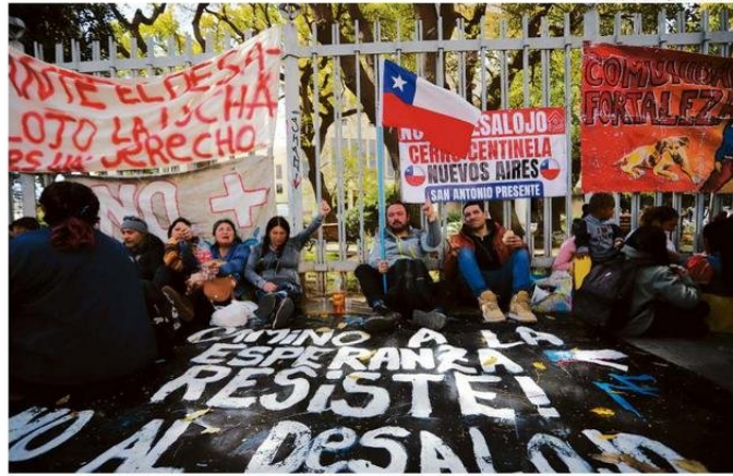
LOS MANIFESTANTES LLEGARON HASTA EL CONGRESO NACIONAL PARA RECHAZAR EL DESALOJO.

Ayer el ministro de Vivienda y Urbanismo, Carlos Montes, recordó que ante la orden de desalojo decretada por la Corte Suprema, “nosotros estamos conver-