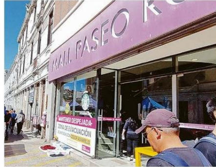
6 DE CADA 10 LOCALES ENTREVISTADOS FUERON VÍCTIMA DE ALGÚN DELITO EL PRIMER SEMESTRE DE 2024.

Pakomio indicó que uno de los hallazgos más alarmantes es el desplazamiento de la confianza, "la que transita desde una que se depositaba en las autoridades como garantes de la seguridad hacia una que se desarrolla entre pares, es decir, los ciudadanos ven más efectividad en aquellas medidas que coordinadamente realizan entre vecinos o loca-