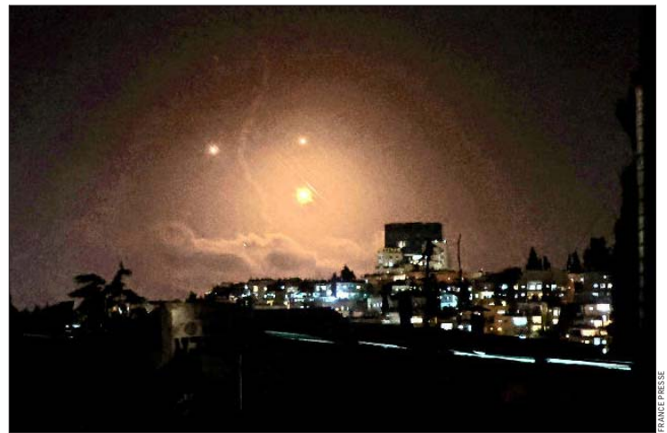
LOS MISILES IRANÍES no provocaron mayores daños en Israel, según el gobierno. En la foto, Jerusalén.