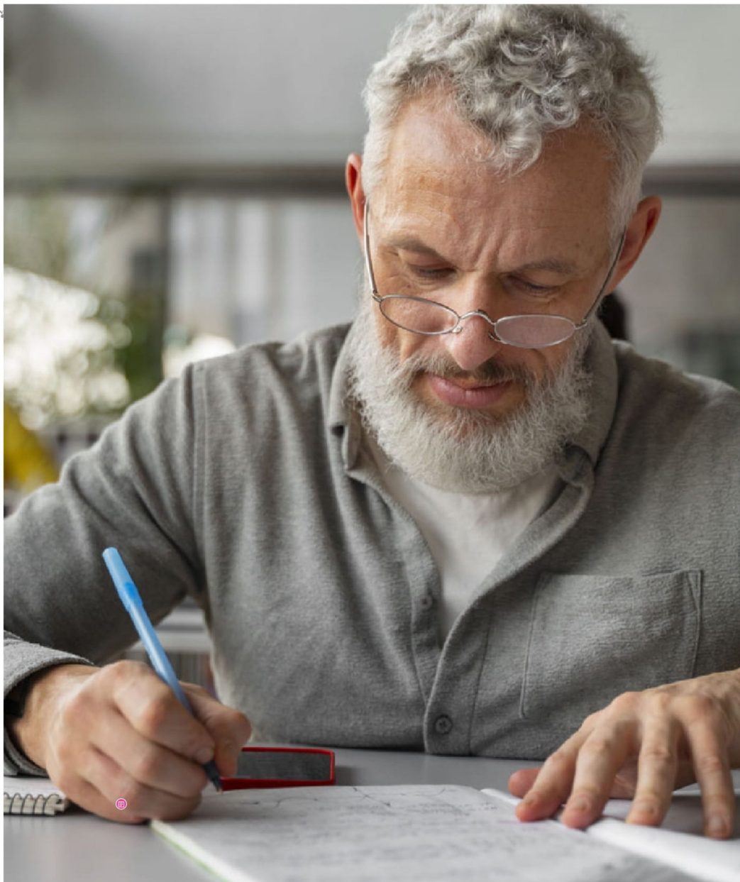
► Hoy, más de 258 mil estudiantes sobre los 30 años está en la educación superior, cifra que representa el 20,3% de la matrícula total del país.

Pero denuncia que el sistema de educación