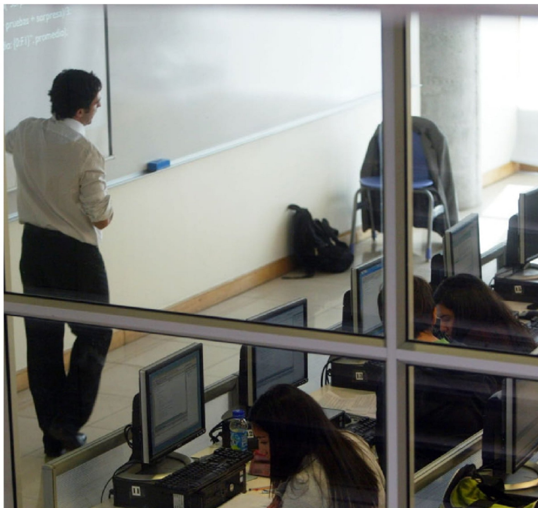
► Otro desafío es la modalidad de estudio, ya que muchos de estos estudiantes trabajan o tienen responsabilidades familiares.