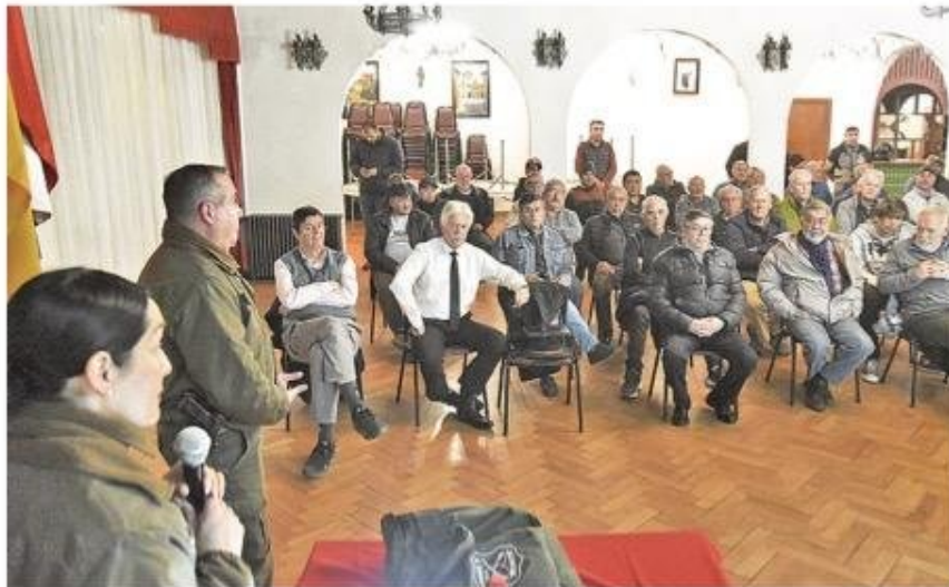
La autoridad fiscalizadora, en este caso Carabineros, ofreció una charla a socios de los diferentes clubes de Caza y de Tiro, los alcances del nuevo reglamento complementario de la Ley N°17.798 sobre Control de Armas, Explosivos y Elementos Similares.