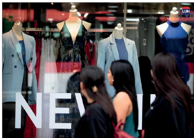
Las personas tienen más tiempo los sábados para darse el placer de comprar.

Sebastian Goldsack, académico de la Facultad de Comunicaciones