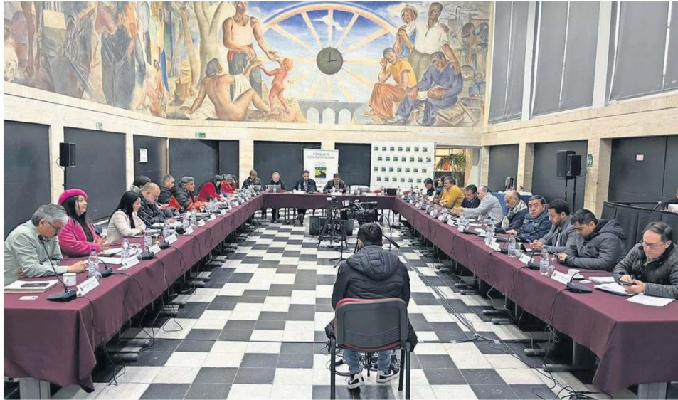
La ejecución del presupuesto 2024 es 15% menor a la que había a igual fecha del año pasado. Los coletazos del caso Convenios han incidido.