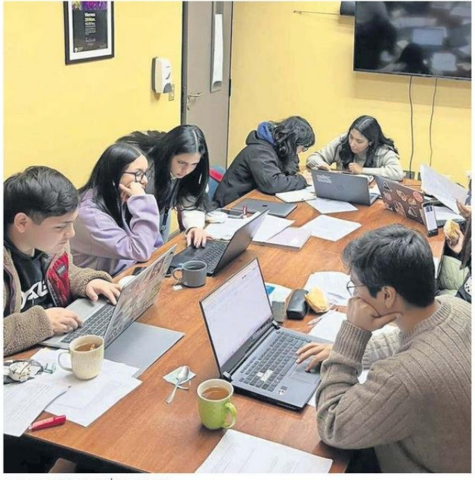
EQUIPO DE INVESTIGACIÓN DE LA UCT.