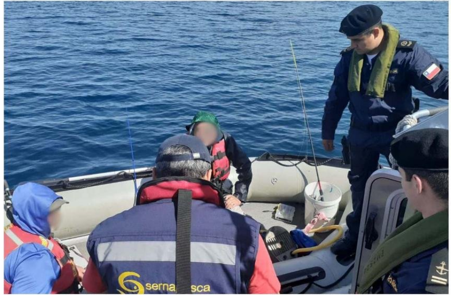
SERNAPESCA FISCALIZA COMO PUEDE, CON ESCASEZ DE PERSONAL, PARA DETECTAR LA PESCA FURTIVA EN LOS RÍOS Y LAGOS DE LA REGIÓN.

En todos estos puntos existen mafias de pesca ilegal que comenzaron a aparecer hace