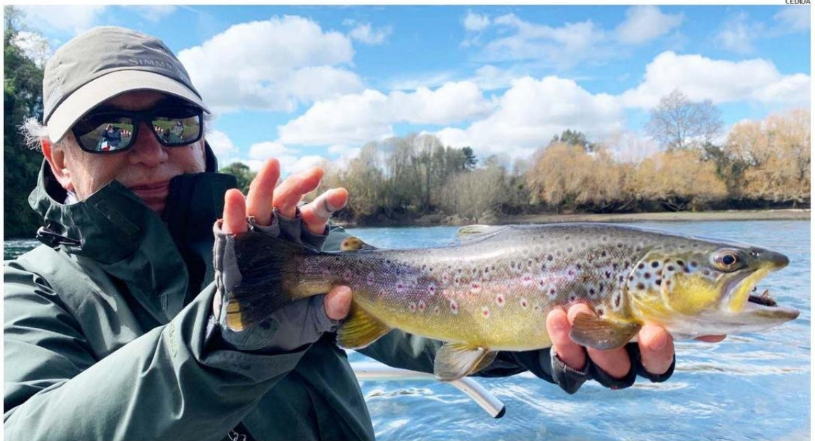
LA APERTURA ANTICIPADA DE PESCA RECREATIVA CORRE SÓLO PARA CINCO CUERPOS DE AGUA DE LA REGIÓN Y ES CON RETORNO OBLIGATORIO DEL PEZ A SU HÁBITAT.

El adelanto de la temporada para estos cinco cuerpos de aguas continentales también significa intensificar los esfuerzos en la lucha contra los pescadores furtivos que actúan du-