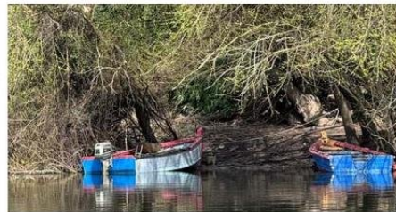
SE HA DETECTADO POR ESTOS DÍAS PESCA DEPREDATORIA EN EL RAHUE.