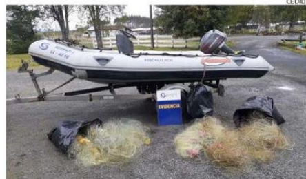
SE HAN DECOMISADO REDES Y SODIAC DE LAS MAFIAS FURTIVAS.