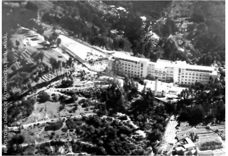
REPOSITORIO UNIDAD DE PATRIMONIO CULTURAL MINSAL