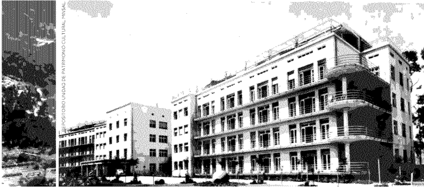
Vista aérea del HEP hacia 1940. El tratamiento se centraba en los baños de sol, higiene y buena alimentación.

El HEP, ubicado en el cerro Las Delicias, fue desarrollado entre 1935 y 1936, bajo la dirección del arquitecto Fernando Devilat Rocca.