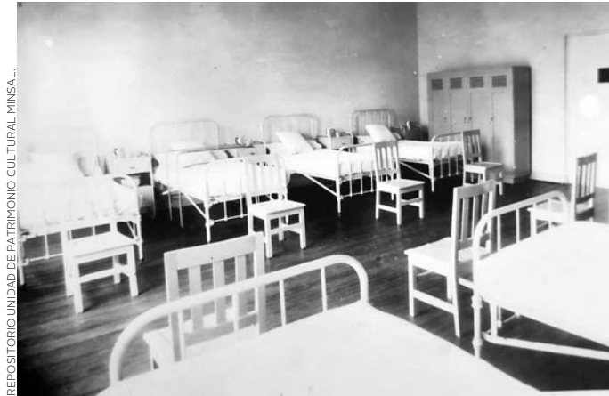
REPOSITORIO UNIDAD DE PATRIMONIO CULTURAL MINSAL