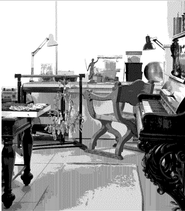
La belleza de los cristales y los bronces la llevó a enamorarse y perfeccionarse en este oficio.