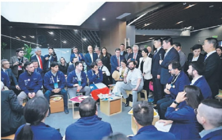
Veinte profesionales visitaron China en el marco del programa New Energy Talent.

de PIB ha disminuido un 26%. Además del desarrollo verde propio, China proporciona el 70% de los componentes fotovoltaicos, el 60% de los equipos de energía eólica y el 60% de los vehículos eléctricos del mundo. Solo en 2023, las exportaciones de productos eólicos y fotovoltaicos ayudaron a los demás países en el mundo a reducir 810 millones de toneladas de emisiones de carbono. En la última década, los costos promedios de la energía eólica y solar a nivel mundial han disminuido en un 60% y 80% respectivamente, y una gran parte de esa reducción de costo se debe a la contribución de China.