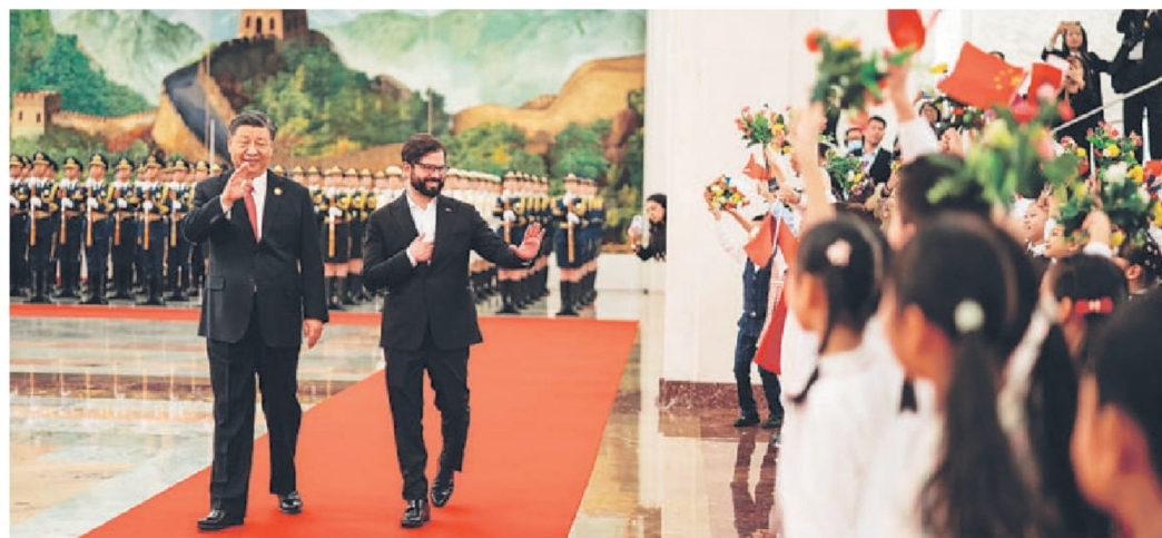
El Presidente Xi Jinping junto al Presidente Gabriel Boric en su visita de Estado a China en octubre de 2023.

El caso de Qinghai es un reflejo de toda China. En las últimas dos décadas, China ha plantado más árboles que el total de todos los demás países, contribuyendo con una cuarta parte del aumento global de áreas verdes. China ha establecido la cadena industrial de energía renovable más grande y completa del mundo, y desde 2012, el consumo de energía por unidad