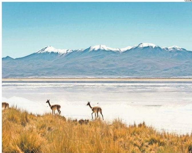
EL SALAR DE ASCOTÁN ESTÁ UBICADO A CERCA DE 150 KM AL ESTE DE CALAMA, EN LA COMUNA DE OLLAGÜE.