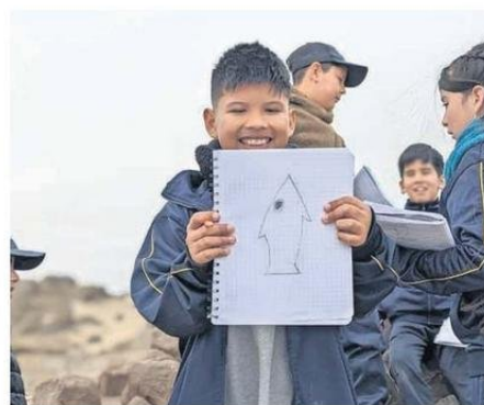
LOS ESTUDIANTES DIBUJARON LOS PETROGLIFOS EN SU CUADERNOS.

EN CALDERA. La Asociación Social y Cultural Changos de Caldera y los estudiantes del 4to básico de la Escuela Manuel Orella se dirigieron al sector de Las Lisas-Petroglifos a fin de apreciar las figuras del pueblo chango.