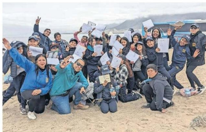
LA SALIDA A TERRENO FUE EN UNA ZONA QUE TIENE RECURSOS MARINOS COMO ANCHOVETA, PEZ ESPADA, BALLENA, ETC.