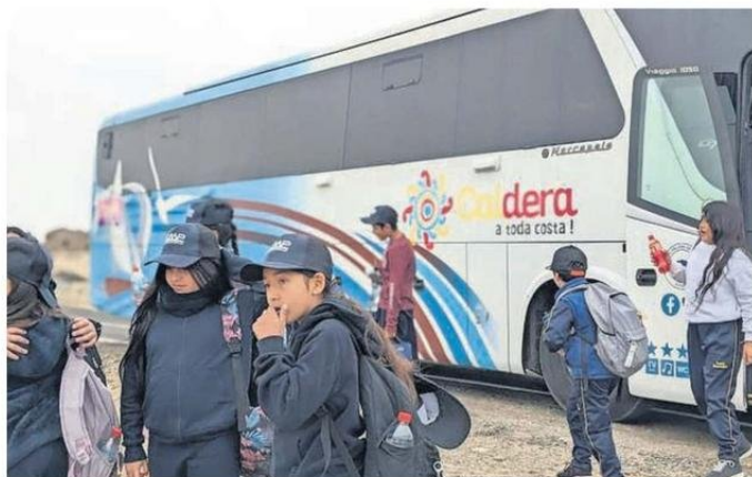
LOS JOVENES PUDIERON APRECIAR EL CONTRASTE ENTRE EL PATRIMONIO NATURAL Y EL DAÑO DEL HOMBRE.