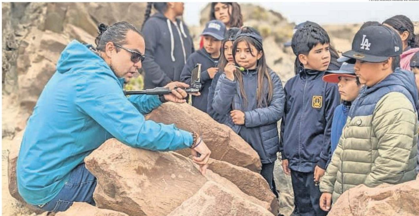
LA ASOCIACIÓN SOCIAL Y CULTURAL CHANGOS DE LA COMUNA PUERTO DE CALDERA, TIENE COMO OBJETIVO FORTALECER EL RESGUARDO DEL PATRIMONIO DEL PUEBLO CHANGO.